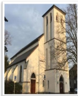
Ev. Kirche Holten

Rüstzeiten und Studienseminare; Lebensbewältigung und Politik, Soziales, Kultur, Heimatgeschichte und Kirche. Wir bemühen uns, das Gefühl zu vermitteln: "Wir sind EAB."