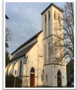
Ev. Kirche Holten

Rüstzeiten und Studienseminare; Lebensbewältigung und Politik, Soziales, Kultur, Heimatgeschichte und Kirche. Wir bemühen uns, das Gefühl zu vermitteln: "Wir sind EAB."