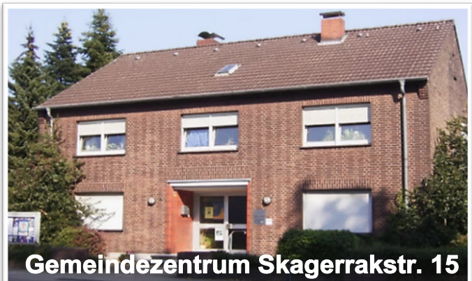
Gemeindezentrum Skagerrakstr. 15